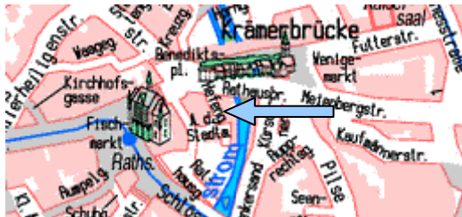
Lageplan der Kleinen Synagoge Erfurt