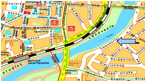
Lageplan des ThürAZ in Jena